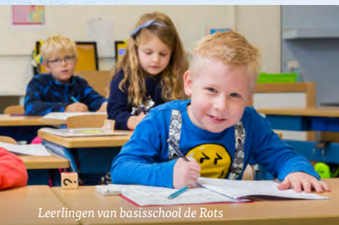
Leerlingen van basisschool de Rots