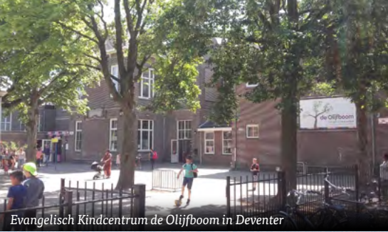
Evangelisch Kindcentrum de Olijfboom in Deventer

gelouterd. En terwijl Hij ons zegende en de Passie leidde, vormde Hij ons ook nog eens. Fantastisch!”