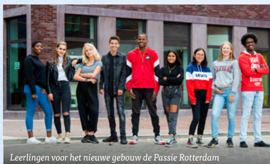
Leerlingen voor het nieuwe gebouw de Passie Rotterdam

gepast. Maar toen werd mijn vrouw wonder boven wonder door God genezen. Dat was voor mij de aanleiding om te bidden: 'Heer, ik zal gaan waar u mij nodig hebt.' Toen ik werd gebeld door de Passie met de vraag of ik wilde komen, wist ik dus wat ik moest doen, maar ik had nog één probleem: hoe zou ik ons aangepaste huis ooit kunnen verkopen? Weer baden we: 'God, als U ons in Utrecht wil hebben, hoe moet het dan met ons huis?' Een paar da-