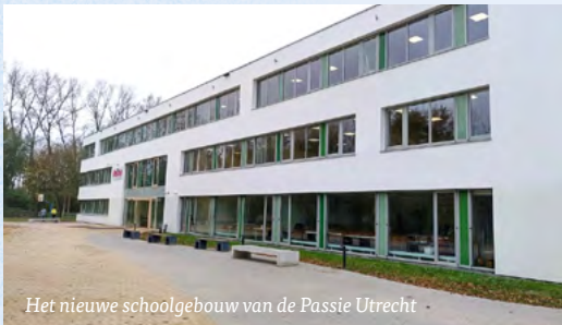
Het nieuwe schoolgebouw van de Passie Utrecht

leerlingen dat het gebouw goed gevuld is. En het Zwarte Woud in Utrecht? Ook daar is het oude, fantasieloze schoolgebouw vervangen door een prachtig nieuw gebouw waar de inmiddels 900 leerlingen en 120 docenten dagelijks met plezier heengaan. De Black Forest Academy ;)