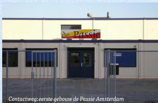
Contactweg; eerste gebouw de Passie Amsterdam