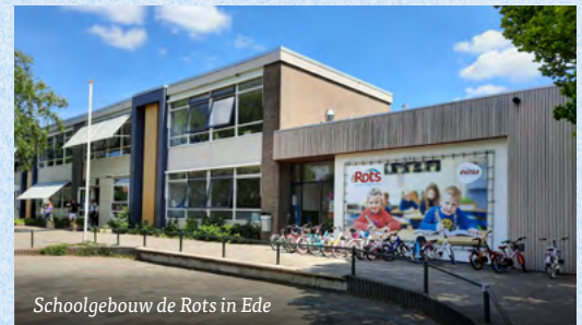
Schoolgebouw de Rots in Ede

Basisschool de Rank verhuisde in 2015 van Arnhem-Noord naar Arnhem-Zuid en basisschool de Rots in Ede heeft nu zoveel