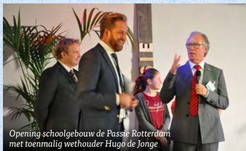
Opening schoolgebouw de Passie Rotterdam met toenmalig wethouder Hugo de Jonge