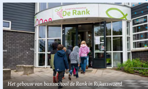
Het gebouw van basisschool de Rank in Rijkerswoerd

De inspectie oordeelde negatief over de kwaliteit van een aantal afdelingen, de stichting verkeerde financieel in zwaar weer waardoor ze zelfs onder verscherpt financieel toezicht kwam te staan en de ontwikkeling van de leerlingenaantallen was op drie van de vier scholen zorgelijk. In Amsterdam moest na een jaar uitstel het zware maar onvermijdelijke besluit genomen worden om de school te sluiten. Een drama voor de bouwers, de ouders en de leerlingen. In dezelfde periode zakte Rotterdam, die eerder de permanente status had behaald, onder de benodigde 488 leerlingen en had Wierden moeite om dat aantal te halen. Er is enorm veel inspanning geleverd om leerlingen te werven en ouders enthousiast te